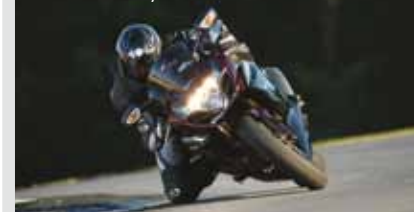
Derbi mopeder og Lett MC