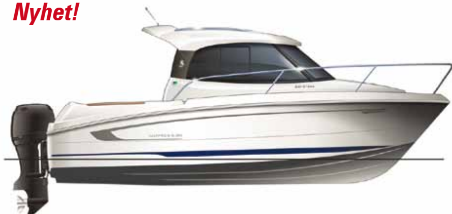
Beneteau 680 Antares