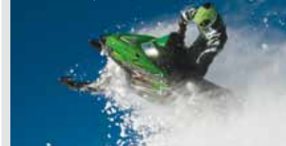
Arctic Cat og Suzuki ATV