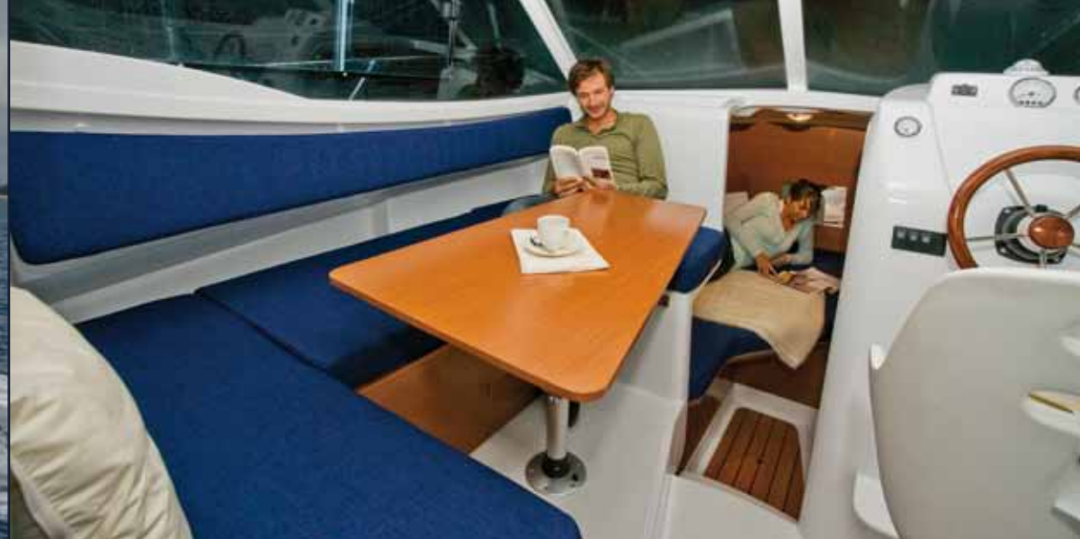
Beneteau Antares 750 - "Suksessen som ble utsolgt i 2009!"