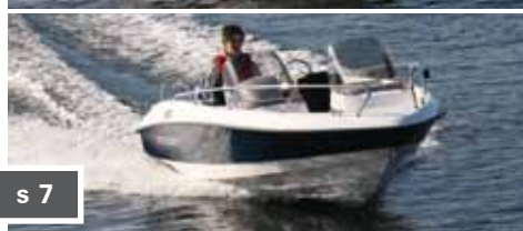
Morgan 490BR s 7