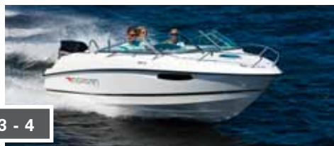
Morgan 630DC s 3 - 4