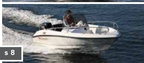
Morgan 485SC s 8