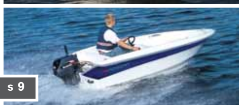
Morgan 350 s 9