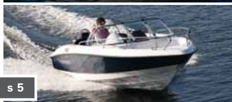
Morgan 530BR s 5