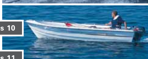
BEVER 460 s 10