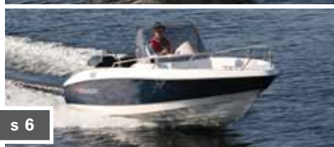
Morgan 525SC s 6